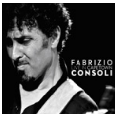
Fabrizio Consoli Live in Capetown