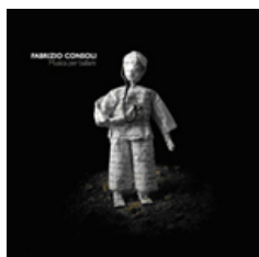
Fabrizio Consoli Musica per ballare